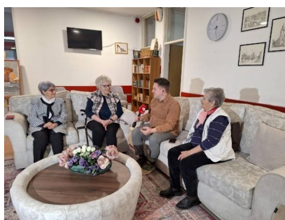
Na slici Č.M., R.B. i N.P. sa novinarom TVSA.