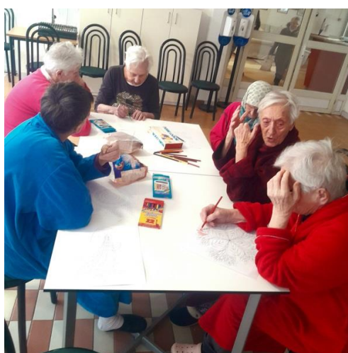
Na slikama dio atmosfere sa kreativne-likovne radionice.