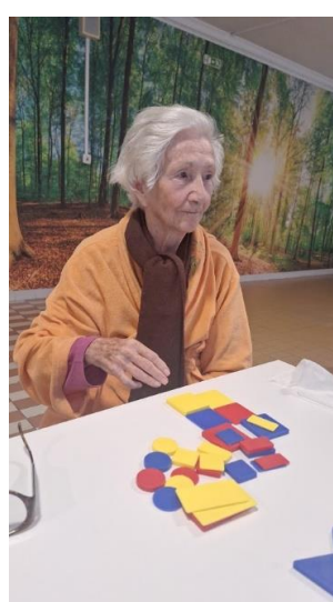
Korisnice E.M i E.Z. u igri koordinacije ruka-oko vježbaju motoričke vještine.