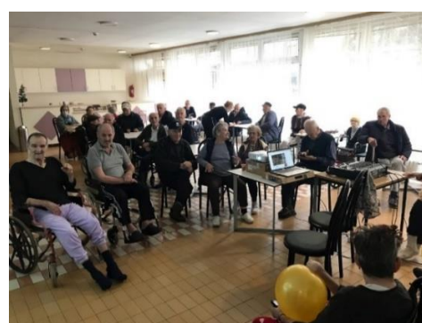
Likovna radionica na III spratu B objekta.